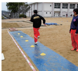
踏切タイミングの集中練習