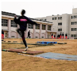
踏切までの助走イメージ練習