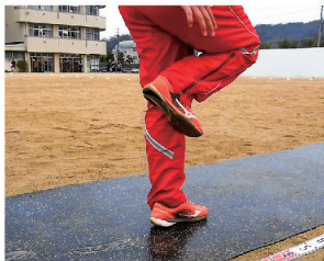
反発を捉える練習に