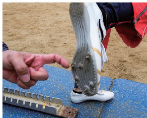
トラックピンスパイクで走る感覚をトレーニング