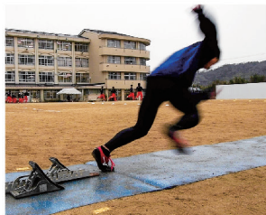
スタートダッシュの集中トレーニング