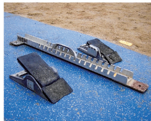
別売の競技用器具もご使用いただけます ※使用いただけない器具もございます