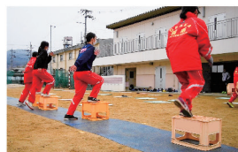
本格練習前のウォーミングアップにも