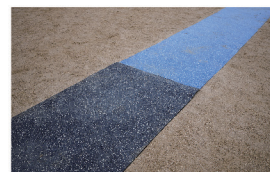
敷くだけで設置完了 敷き方の工夫で高跳びにも使用できます