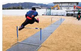
インターバルの感覚を養う練習